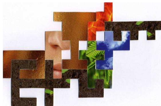
Bunte Meditationsbilder vertiefen das Verständnis.